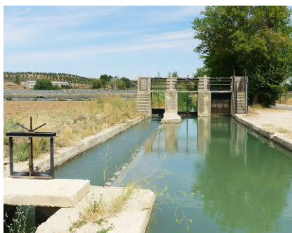
Compuertas del Rey