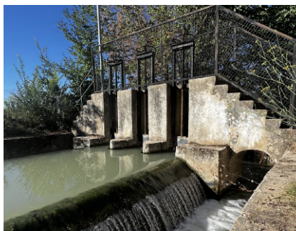
Compuertas de Pico-Pata