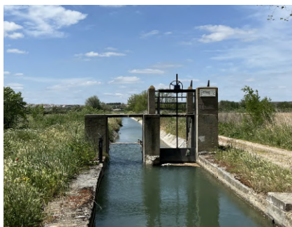
Compuerta del Cortijo