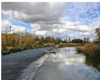
Presa de Embocador